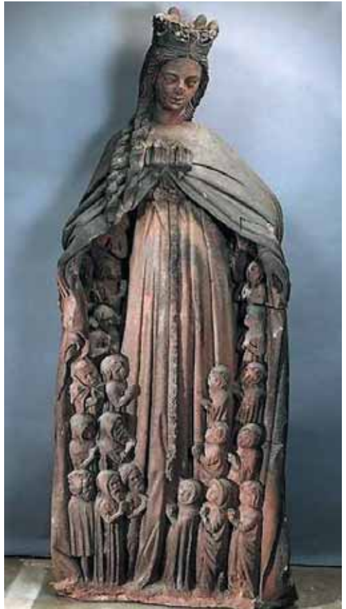
Original der Statue vom Turm des Freiburger Münsters (heute durch eine Kopie ersetzt)